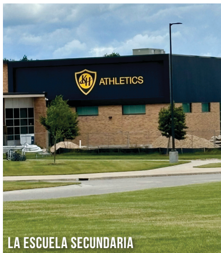
LA ESCUELA SECUNDARIA

Para obtener información sobre las tarifas de participación y los requisitos de forma física, visite khps.org/athletics .