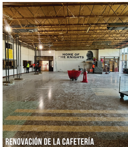
RENOVACIÓN DE LA CAFETERÍA

La fase 5 comenzará en otoño, antes de lo previsto. Esta será la última fase de la construcción de la escuela secundaria y se espera que esté terminada el próximo verano. ¡Estamos ansiosos por mostrar el producto terminado!