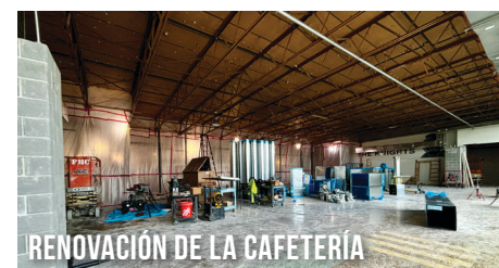
RENOVACIÓN DE LA CAFETERÍA